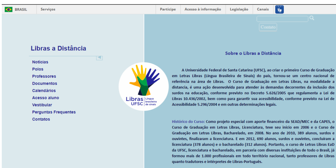
Imagem 2. Ambiente Virtual de Aprendizagem do Curso de Letras Libras

Após acessar a página própria da UFSC ( https://libras.ufsc.br/ ), o aluno poderá acessar o ambiente virtual de aprendizagem próprio do curso de Letras Libras, onde consta (Notícias, Polos, Professores, Documentos, Calendários, Acesso aluno, Vestibular, Perguntas Frequentes, Contatos) como mostra a imagem a baixo.