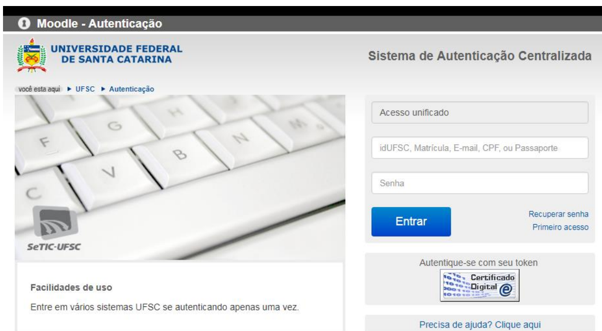
Imagem 3. Área do aluno

Ao acessar a área do aluno, é possível acessar o ambiente próprio do aluno, no qual é estruturado pela ferramenta Moodle . Veja imagem abaixo.